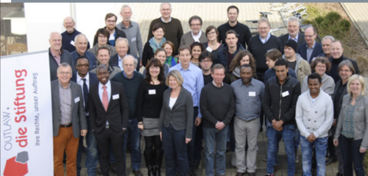
Die Teilnehmer*innen der Nordermeyer Gespräche

Ein anderes altes Problem ist die strukturelle Überforderung kommunaler Verantwortung und Finanzierung mit den Aufgaben einer modernen Kinder- und Jugendhilfe. Hier zeigen lokales Zusammenwirken von Politik, Verwaltung, Träger